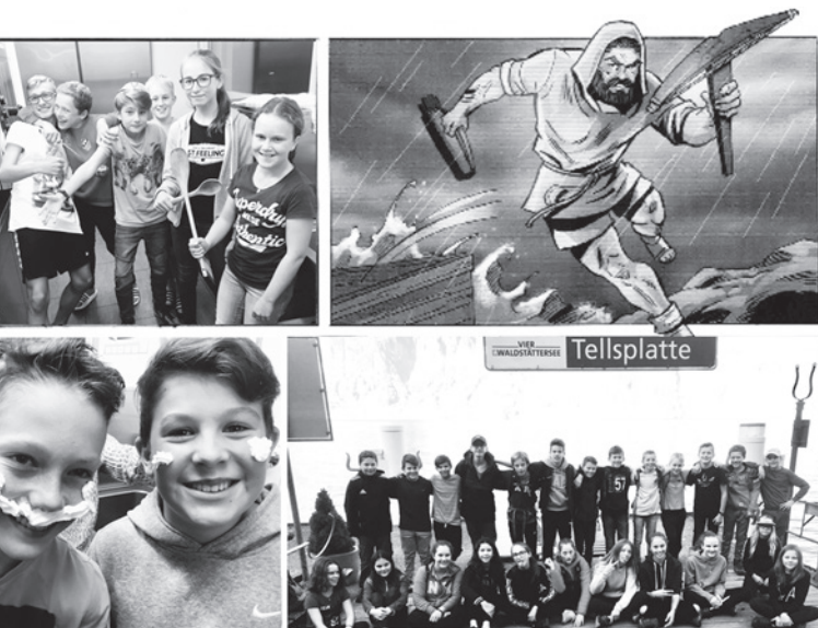
Collage zur Arbeitswoche der 1c