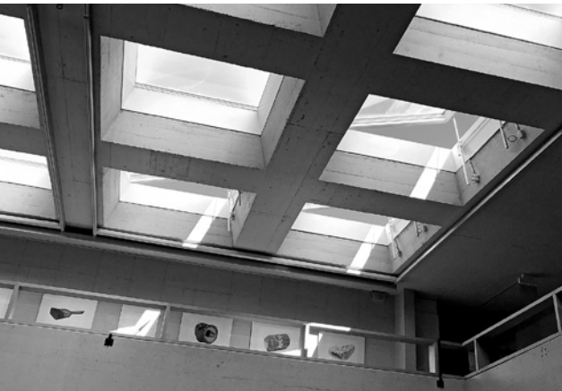
Neue Dachkuppeln mit ferngesteuerter Öffnung

Eine Schule baut an der Zukunft der Gesellschaft. Wir bauen auch für die Zukunft der Kantonsschule Beromünster. Die Bauarbeiten der letzten und der kommenden Monate verhelfen der ganzen Schulgemeinschaft zu mehr Komfort und zu zeitgemässen Unterricht.