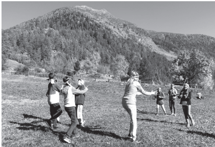
Bei herrlichem Wetter durften wir oft draussen sein.