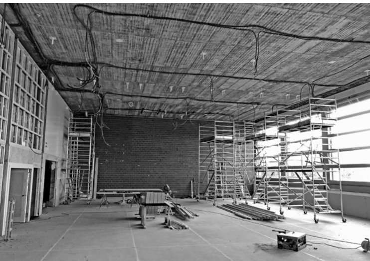
Baustelle der Turn- und Sporthalle im August 2018