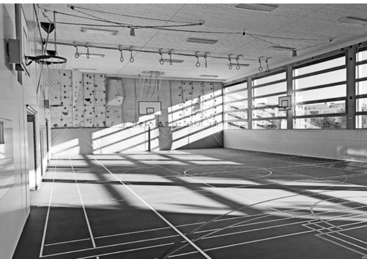
Sanierte Turn- und Sporthalle im Oktober 2018

Die Bedürfnisse der Gesellschaft ändern sich, genauso wie Sicherheitsbestimmungen und amtliche Vorgaben. Ein moderner Unterricht erfordert immer wieder bauliche Massnahmen. In den Sommerferien sowie in den Wochen zwischen Sommer- und Herbstferien wurde in allen KSB-Gebäuden gebaut. Im A-Trakt mussten sämtliche Dachkuppeln ausgetauscht werden. Wir nutzten die Gunst der Stunde und installierten sogleich mehrere Motoren zum automatischen Öffnen und Schliessen der Kuppeln. Damit wird im Sommerhalbjahr eine Nachtauskühlung des Gebäudes ermöglicht, was das Wohlbefinden tagsüber stark erhöht. Im D-Trakt wurden die Fenster neu gestrichen und die Rollläden ersetzt. Sie waren durch die Witterung der letzten Jahre beschädigt worden.